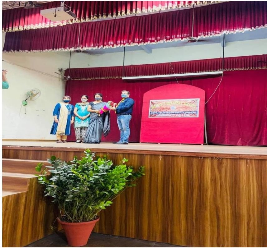
PULSE DIAGNOSIS CAMP ORGANISED TO PRESCRIBE AYURVEDIC REMEDIES FOR VARIOUS AILMENTS