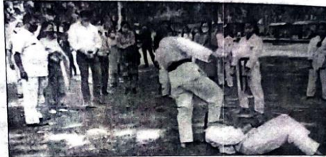
ਗਤੀਵਿਧੀਆਂ ਵਿੱਚ ਹਿੱਸਾ ਲੈਂਦੀਆਂ ਹੋਈਆਂ ਖਿਡਾਰਨਾਂ।