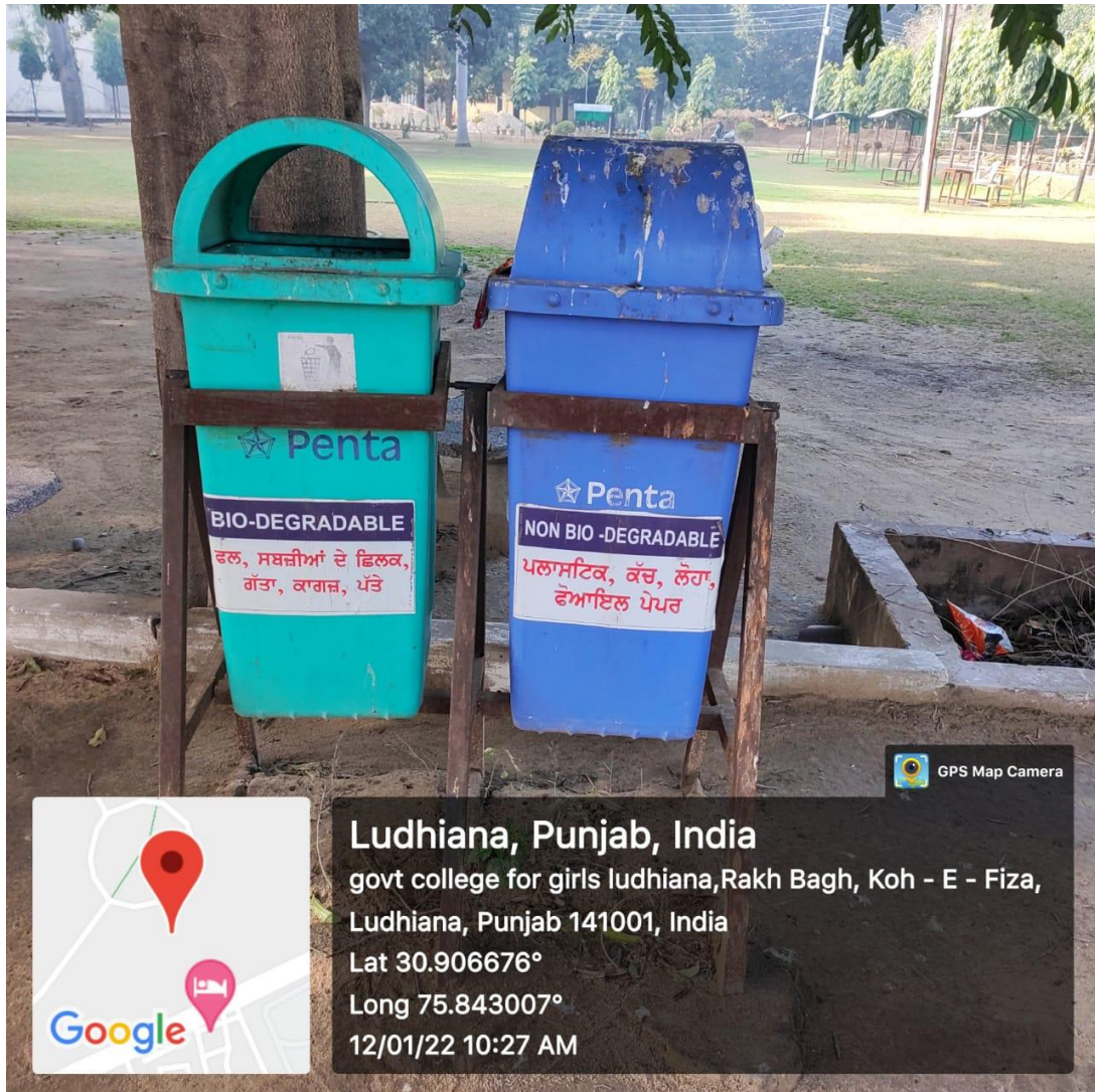
GREEN AND BLUE COLOURED DUSTBINS FOR SEGREGATION OF WASTE