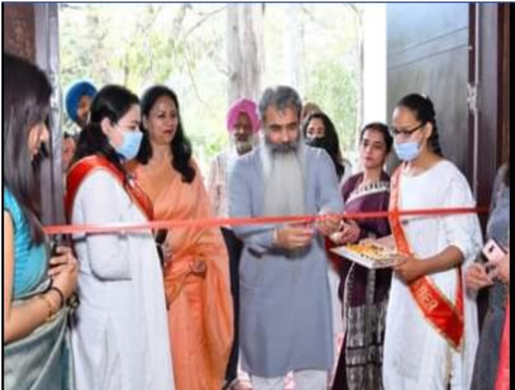
RUSA SEMINAR HALL